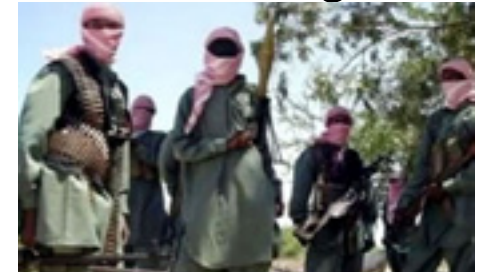
Boko Haram sect, Nigeria.

Los periodistas y medios de comunicación por igual deben moldear las percepciones de la gente sobre la contrainsurgencia en curso en la región norte de Nigeria, como bien general y no la guerra del gobierno contra el Islam. Esto se basa en que el tópico de que ningún gobierno responsable desee aniquilar a su pueblo, sino que tiene la responsabilidad de protegerlos en basado en la teoría del contrato social, tal como fue propuesto por John Locke, que el gobierno en toda sociedad es una organización del consentimiento de las personas. Además, se cree que la contrainsurgencia tendría éxito sólo cuando los medios de comunicación difunden la información oportuna que podría mejorar el conflicto de alerta temprana y mecanismos de respuesta.