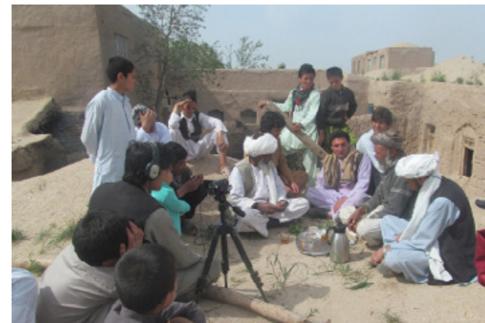
Grabando historias no contadas en Afganistan como parte del proyecto