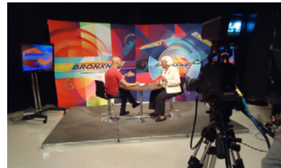
Grabando un programa para BronxNet TV como parte del proyecto

Después se realizaron los primeros reportajes, los estudiantes que compilan en un programa de paz con temas de BronxNet.