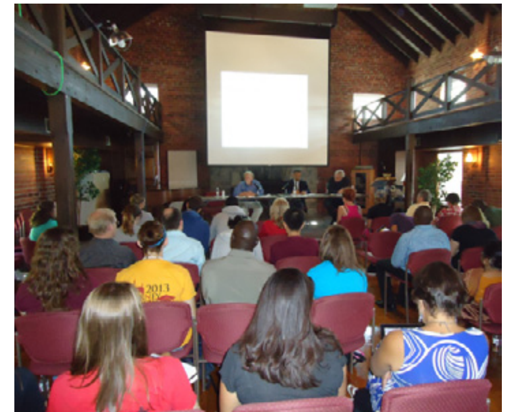
"Haciendo lo incorrecto" atrajo mucha gente en la Universidad de Park el 27 de septiembre.