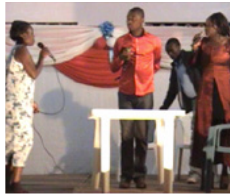
Actores muestran como la paz prevalece en el oeste de Uganda.

El drama esta compuesto de humor, sátira y suspenso, engañado a castigar a los males sociales y los conflictos, la promoción de las buenas costumbres y la transformación campeona hacia una sociedad pacífica. La obra pone de manifiesto la ironía de la vida en un ajuste local hasta que se caracteriza por conductas impropias de los caracteres individuales de un paquete