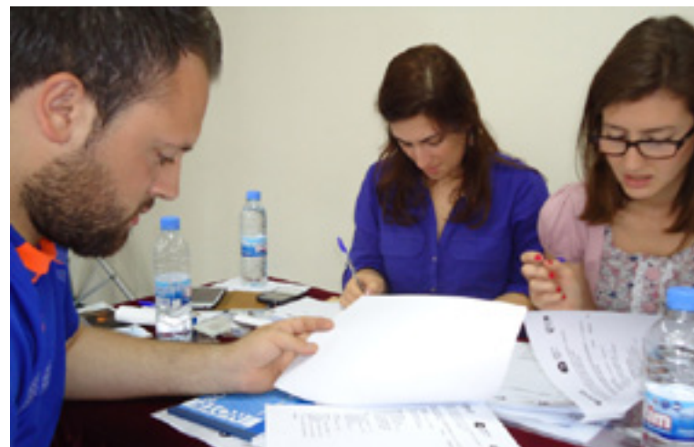
Beirut, Líbano proyecto de periodismo de paz, en la página 8