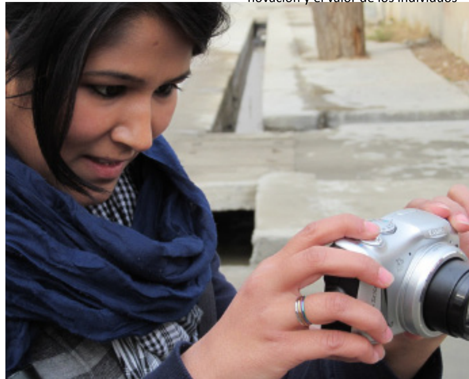
Reporteros usan equipos de multimedia como parte del proyecto.

Una visita a la página web de Voces Afganas revela el contenido ecléctico. Hay un segmento sobre el cambio en la moda popular desde la caída de régimen Talibán, ajuste a ritmos pegadizos e historias de niños que trabajan desde la mañana hasta en la noche para mantener a sus familias; y documentales que celebran la innovación y el valor de los individuos