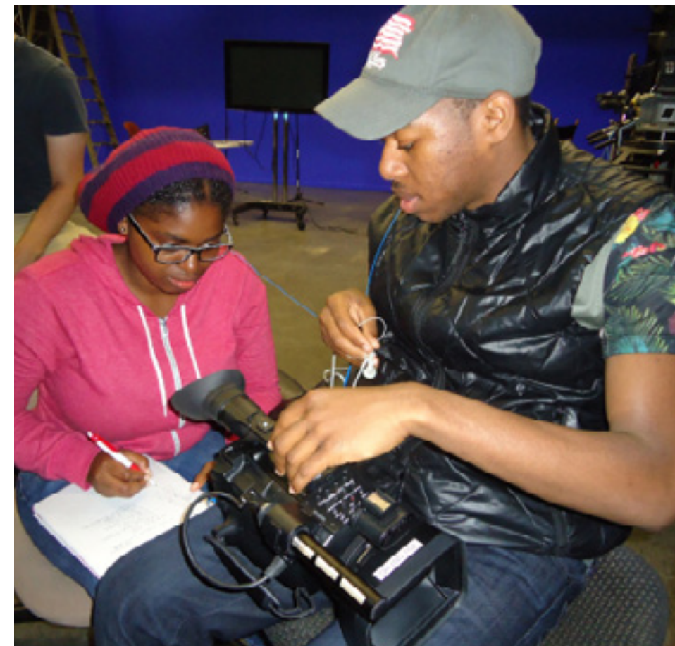
Preparando para grabar en la practide de periodismo en los Bronx, Nueva York. pg 12