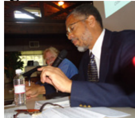
Lewis Diuguid, Kansas City Star

Lofflin y sus colegas del simposio no son los únicos en discusiones acerca